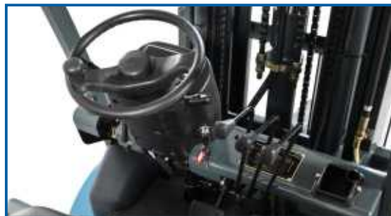
Das Cockpit ist klar und übersichtlich gestaltet. Es bietet viel Platz und Beinfreiheit. Alle Bedienelemente sind leicht zugänglich.

Das Cockpit ist funktionell und übersichtlich gestaltet, sodass alle Bedienelemente immer im Blickfeld sind. Bedienelemente sind gut erreichbar und ohne Umgreifen zu bedienen. In der Serienausstattung ist ein KAB211 Komfortsitz enthalten. Dieser Sitz ist mechanisch gefedert und bietet hervorragenden Sitzkomfort durch die ergonomische Aufpolsterung. Selbstverständlich lässt sich der Sitz sowohl in der Tiefe, als auch in der Sitzneigung verstellen und hat eine dreifache Gewichts-anpassung. Damit können Personen jeder Größe bequem im Cockpit platz nehmen.