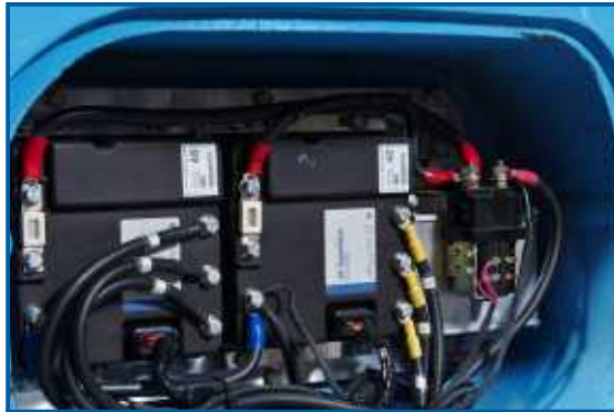
Die DANAHER AC-Controller sind im Heck angebracht und über ein CAN-BUS-System miteinander verbunden.

Die Boardelektronik ist, von einer soliden Stahlblechblende verdeckt, im Heck des Staplers montiert und mit wenigen Handgriffen leicht zugänglich.