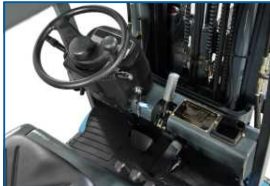
Das Cockpit ist klar und übersichtlich gestaltet. Es bietet viel Platz und Beinfreiheit. Alle Bedienelemente sind leicht zugänglich.

Verschiedene Komfortsitze der Marken GRAMMER®, SAVAS®, KAB®, etc. ergänzen die Auswahlmöglichkeiten. Bitte fragen Sie Ihren HanseLifter Händler.