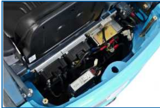
Die Boardelektronik ist leicht zugänglich im Heck des Staplers untergebracht und kontrolliert die drei Motoren

Die Boardelektronik ist, von einer soliden Stahlblechblende verdeckt, im Heck des Staplers montiert und mit wenigen Handgriffen leicht zugänglich.