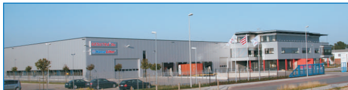
HanseLifter Verwaltungs- und Logistikzentrum, Bremen

HanseLifter bietet europaweit hochwertige Markenqualität zu attraktiven Konditionen. Persönlicher Kundendienst und ein zuverlässiger Service sind unsere Stärken. Für jeden Ansatz der Fördertechnik die perfekte Lösung und das zum besten Preis. Ein dichtes Händlernetz garantiert immer schnellen Service in Ihrer Nähe. In über 20 Ländern schätzen unsere Kunden den HanseLifter und die zuverlässige Qualität. Wer sich für HanseLifter entscheidet, hat das Optimale an Qualität und Leistung - alles aus einer Hand.